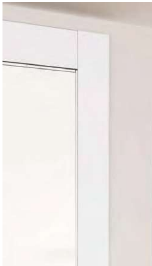
Particular jamba de melamínico blanco