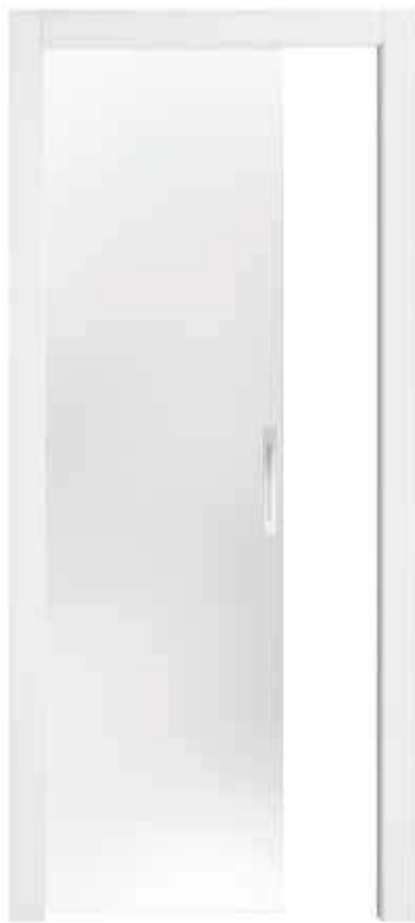
Puertas de cristal para Base en melamínico blanco