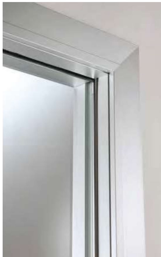
Particular jamba de aluminio