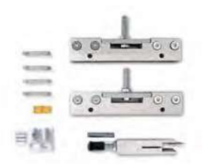
Alicates para puertas de cristal

El kit de herrajes para hojas de cristal es un accesorio que se puede utilizar en los premarcos Scigno Essential de una y de dos hojas. Permite la instalación de una hoja de cristal de grosor variable (8 o 10 mm). Se puede instalar una jamba de madera o de aluminio, garantizando la total ocultación de la abrazadera, para ofrecer un resultado estético de lo más elegante y fino. Las abrazaderas, gracias a un moderno sistema a presión, no requieren que se practique orificio alguno en la hoja de cristal. Se puede combinar con el sistema de enlentecimiento del cierre Slow Glass.