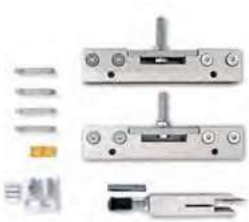
Alicates para puertas de cristal

El kit de herrajes para hojas de cristal es un accesorio que se puede utilizar en los premarcos Scigno Base de una y de dos hojas.