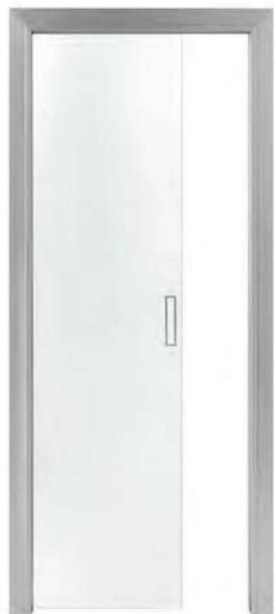
Puertas de cristal para Base en jamba de aluminio